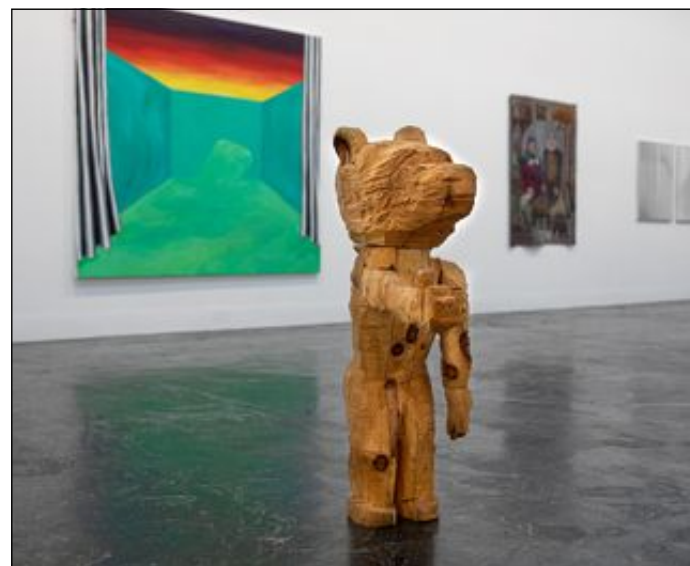
Ikke røre. Morten Vidar Grans grovt huggete dyreskulptur «Dyrisk 2» strekker frem en «hånd».