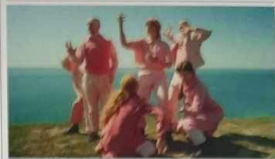
"This is not a religion" spelas på Bastionen i Malmö till och med i dag, 2/9, och går sedan på turné.